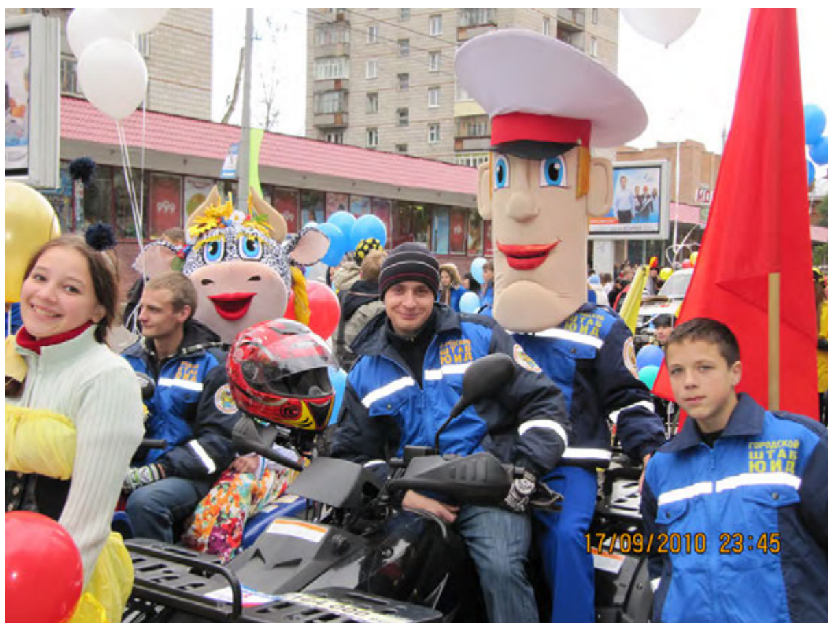
Городской штаб ЮИД