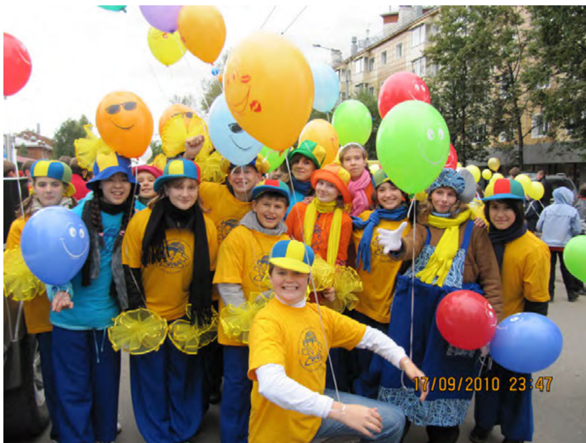
Игровой клуб "Колобки"

Штаб Поста № 1 возглавлял колонну карнавала