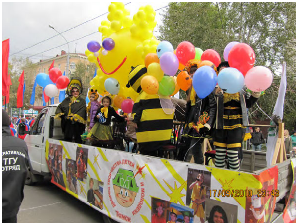
Школа для девочек "Бусинка" на городском карнавале