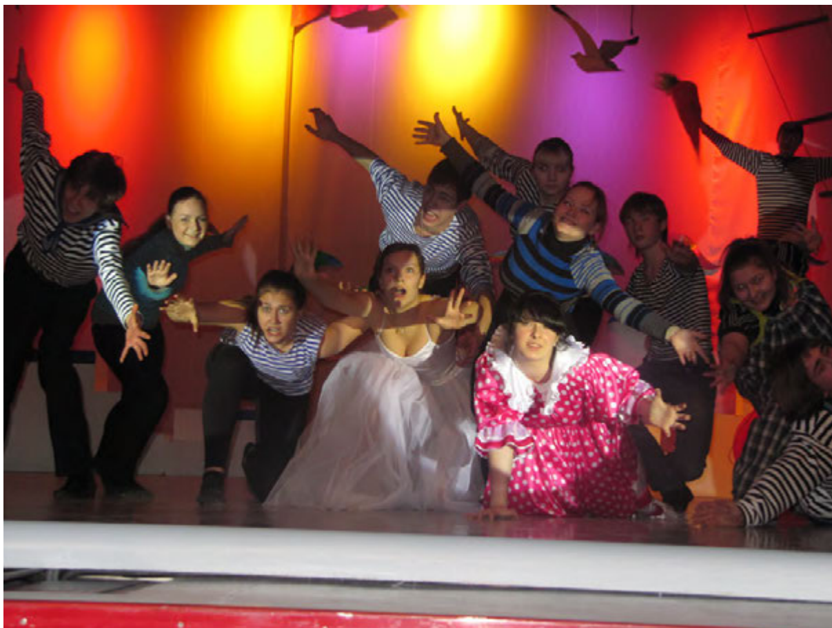
На сцене литературно-художественный театр Школа-студия народного танца "Русские забавы"