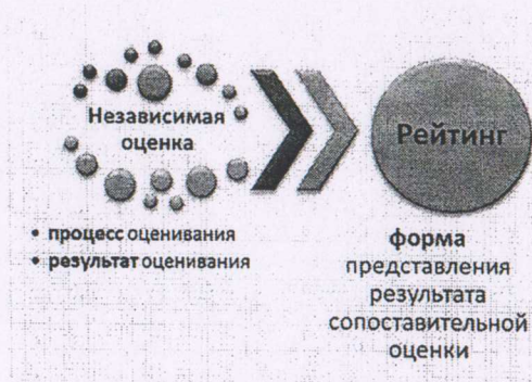
Рисунок 5. Схема формирования рейтинга в процессе проведения оценки

Если не проводится сопоставление разных школ между собой, то построить рейтинг невозможно. С другой стороны, – если в результате мониторинга или иной оценочной процедуры появляется база данных (набор оценок) по разным образовательным организациям, то неизбежно возникает соблазн выстроить эти школы по порядку: от лучших – к худшим. Так возникает рейтинг.