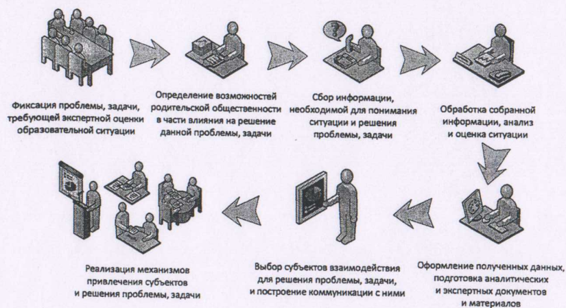
Рисунок 1. Алгоритм проведения экспертизы образовательных ситуаций

Проведение оценки качества деятельности образовательной организации можно представить в виде следующего алгоритма действий (рис. 1):