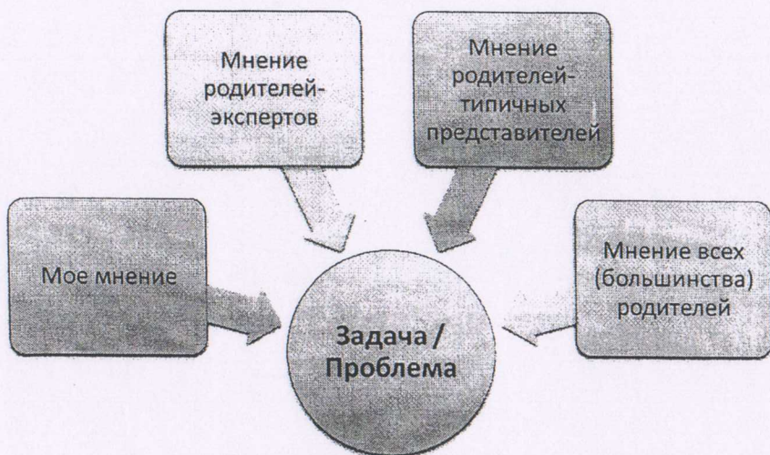
Рисунок 2. Модель выявления проблемы или задачи развития образовательной организации методом расширения круга заинтересованных субъектов.

Начать эту работу можно с формулировок проблем, актуальных для основных инициаторов данной работы (рис. 2).