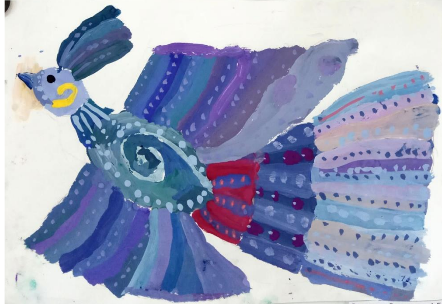
Родикова Вероника, 1 Б «Веснянка», бум. Гуашь Преп. Золотарева А.В