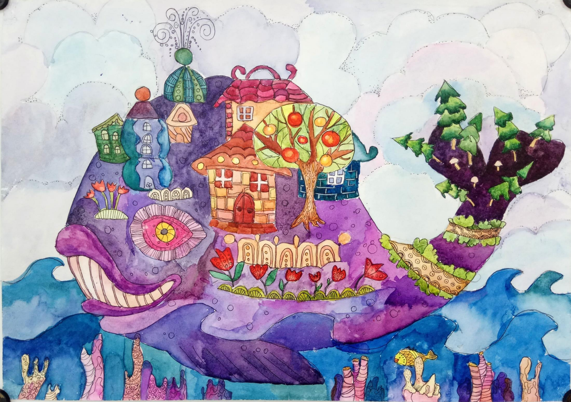
Амангельдиева Лейла, 4А «Рыба-кит», Бум., акварель