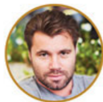
Олег РОЙ Российский писатель и общественный деятель, член Экспертного совета

«Я хочу пожелать проектам честного зрительского выбора. Пожелать Премии неутомимого, интересующегося зрителя, который будет выбирать проекты, тронувшие сердце.»