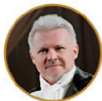
Вячеслав НЕВИННЫЙ заслуженный артист РФ, актёр МХТ им. Чехова

«Целесообразность этой Премии, которая направлена на выделение очень правильных, талантливых, чистых людей – очевидна!»