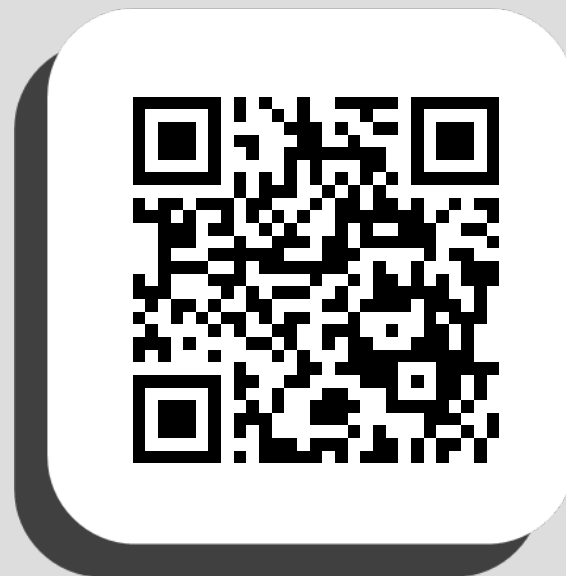
QR-код для регистрации в конкурсе